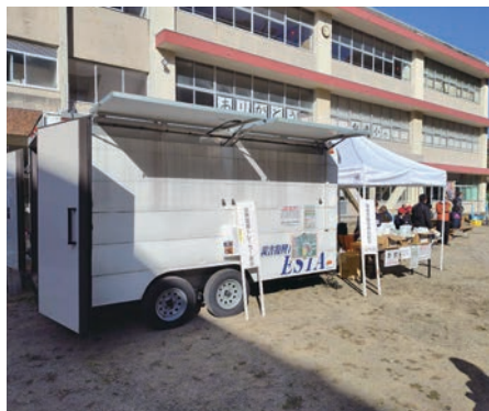
災害復興トレーラーの展示 (和歌山県町村会導入)