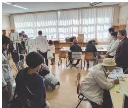
土砂災害に関する展示