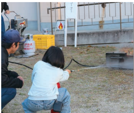
水消火器による消火体験