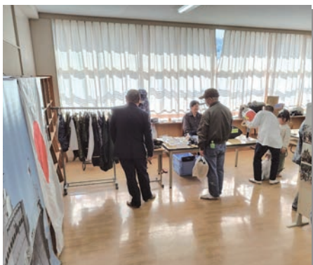
海上自衛隊によるパネル展示