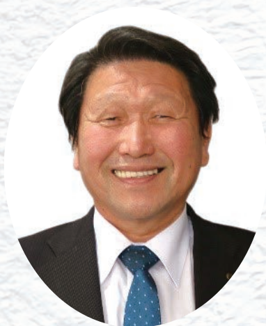
町長 山名 実

本年が皆さまにとって、健康で心豊かな一年となりますよう心よりお祈り申し上げ、新年のごあいさつとさせていただきます。