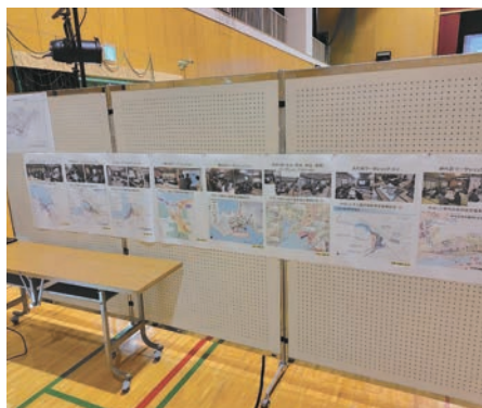
事前策定復興計画の展示