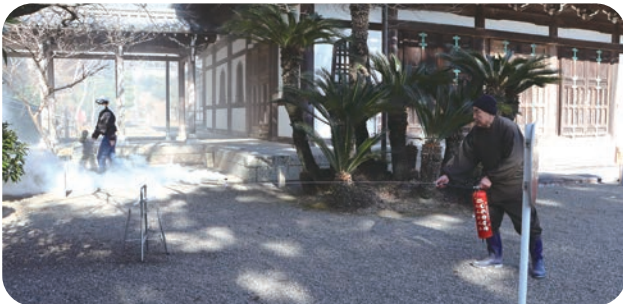
初期消火活動の様子