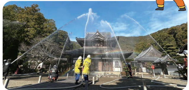
法堂（本堂）に向け放水