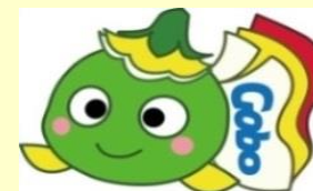
ハローワーク御坊マスコットキャラクター まめぴー