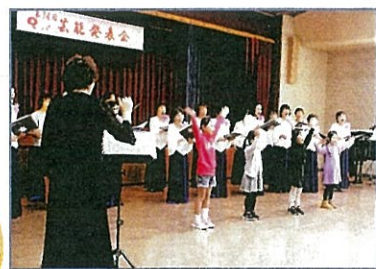
● 第38回芸能発表会 11月23日開催