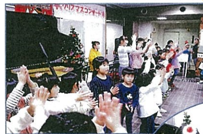
● クリスマス コンサート 12月21日開催