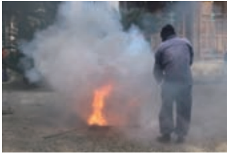
初期消火活動の様子

1月26日（金）に興国寺で、日高広域消防本部、由良町消防団及び興国寺自衛消防団による総合消防演習を行いました。法堂（本堂）から出火したという想定で訓練を行い、初期消火活動や水源からの消火活動を行いました。