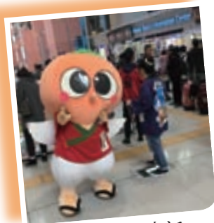
たくさんの人にアンケートとるぞー！