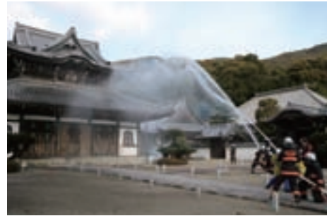
法堂（本堂）に向けて放水