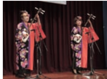
津軽三味線の演奏