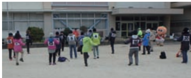
みんなで準備体操～♪イッチ！ニッ！

大引から白崎海洋公園まで歩き、町花の「水仙」がたくさん咲いていて、青い空、青い海とマッチして、とっても綺麗だったよ♪歩いた疲れもどこかへ吹っ飛んでいっちゃった！！みんなもぜひ来年は参加してみてね♪