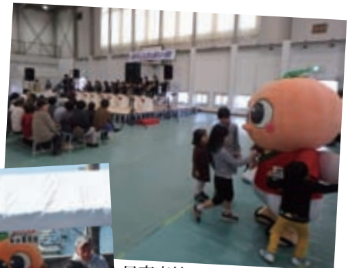
日高高校プラスバンド部の演奏 いい音色だなー・・・