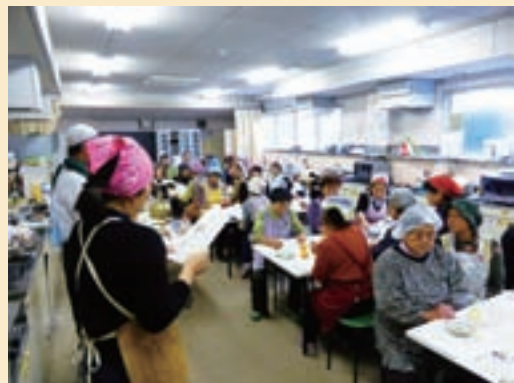
栄養士から料理のおすすめポイントの説明