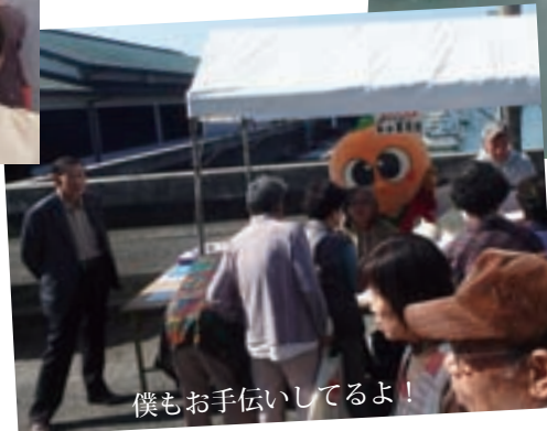
僕もお手伝いしてるよ！