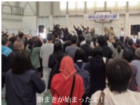
餅まきが始まったよ！

10月30日（日）に開催されたゆらふれあい祭に参加してきたよ！例年雨が多くて今年もどうかなって思ってたけど、すっごくいい天気で、ふれあい祭日和になったよ！僕も参加してきたけど、どのブースもおいしそうな産品が並んで、よだれがでそうだったよー！我慢できなくてイリュージョンでおでんは食べちゃったけどね♪そのほかにも総務政策課の耐震診断相談、防災グッズ、非常食の試食コーナーや地元企業の紹介ブースなど、舞台イベントでは吉本興業のポートワシントンの漫才や日高高校プラスバンド部の演奏などすっごく盛り上がっていたよ♪来年もまた行きたいなー！