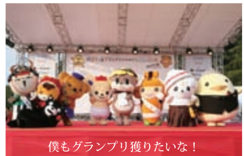
僕もグランプリ獲りたいな！

今年も開催されたゆるキャラグランプリ。今年は高知県須崎市の「しんじょう君」がグランプリを獲得したよ！僕の最終獲得票は726票だったよ♪みんなほんとうに応援ありがとうね！来年はもっといい順位になれるように頑張るぞー！！