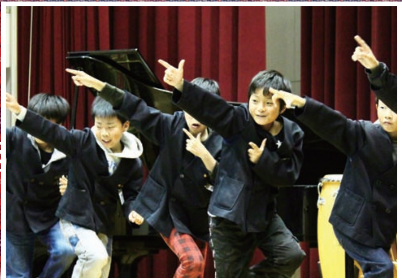
学習発表会でパフォーマンスをする児童(由良小)

●由良町の人口と世帯( )前月比 人口6,127(-7) 男3,010(-4) 女3,117(-3) 世帯数2,754(-1)(平成28年10月末現在)