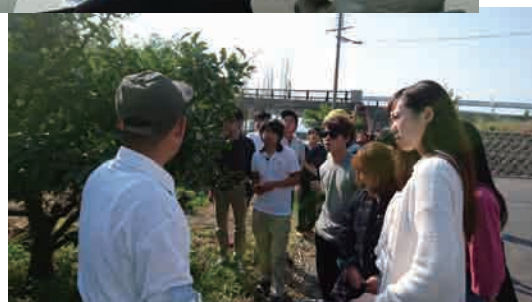
町内でのフィールドワークの様子