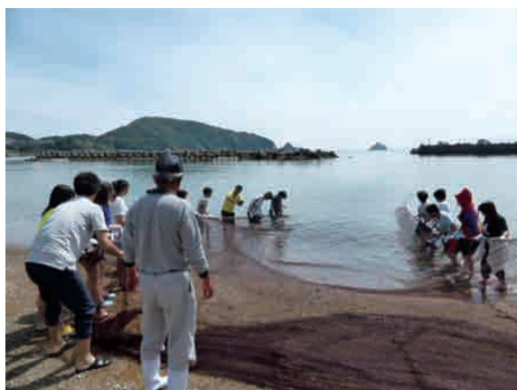
地引網体験！みんなで力を合わせて！