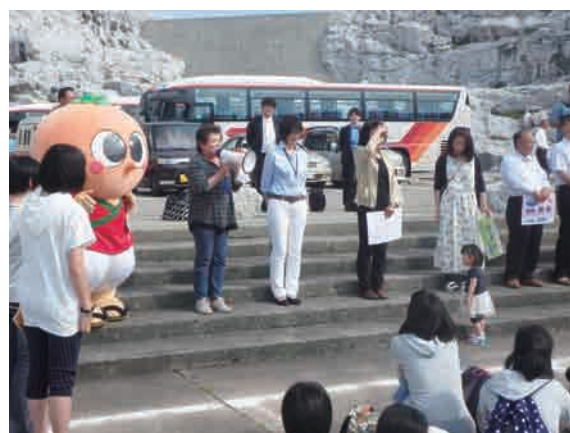
旅館の方と一緒に お出迎え♪

ゆらの助の日々の活動などを Facebook で随時更新中！ぜひチェックしてね♪