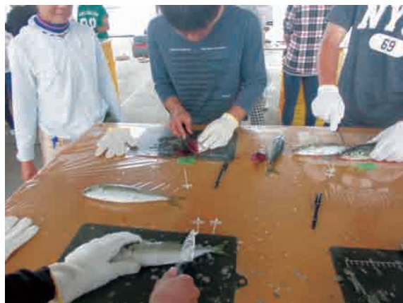
教えてもらいながら魚の開き体験！