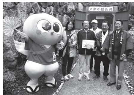
三重からお越しの1万人目の来場者

11月28日（土）に戸津井鍾乳洞年間来場者数が、1万人を突破しました。これは、実に平成9年以来18年ぶりのことで、テレビや雑誌、またネット等に取り上げていただいたことが来場者数の増加につながったと考えられます。