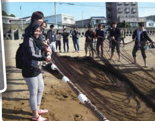
大引の浜で地引網体験