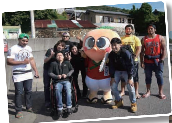
ツアーに参加した留学生たち

園内でのセグウェイ試乗、ゆら語り部クラブの案内による興国寺参拝など、由良町の観光を満喫できる内容となっていました。 ツアーに参加していた留学生たちからも「とても良い経験ができました」などの感想が聞かれ、好評だったようです。