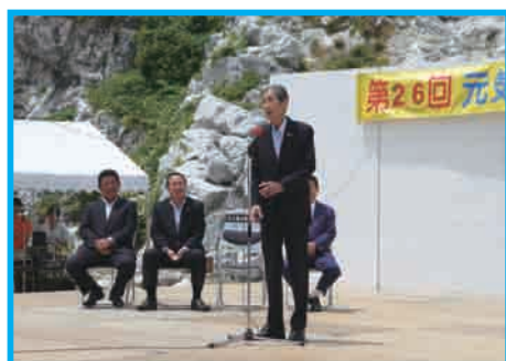
畑中町長あいさつ