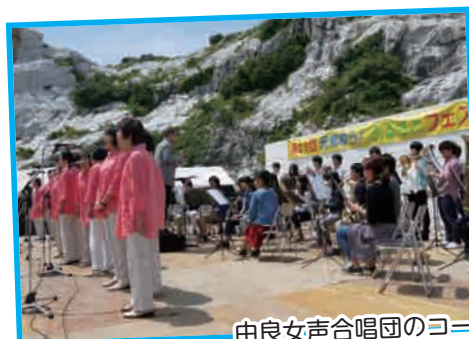
由良女声合唱団のコーラスと摂南大学吹奏楽部の演奏