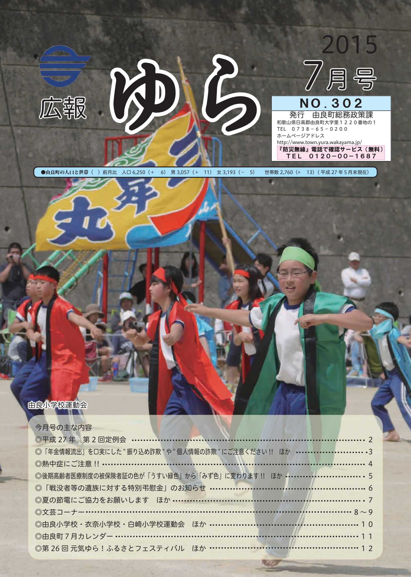
由良小学校運動会

●山良町の人口と世帯 ( ) 前月比 人口6,250 (+ 6) 男3,057 (+ 11) 女3,193 (- 5) 世帯数2,760 (+ 13) (平成27年5月末現在)