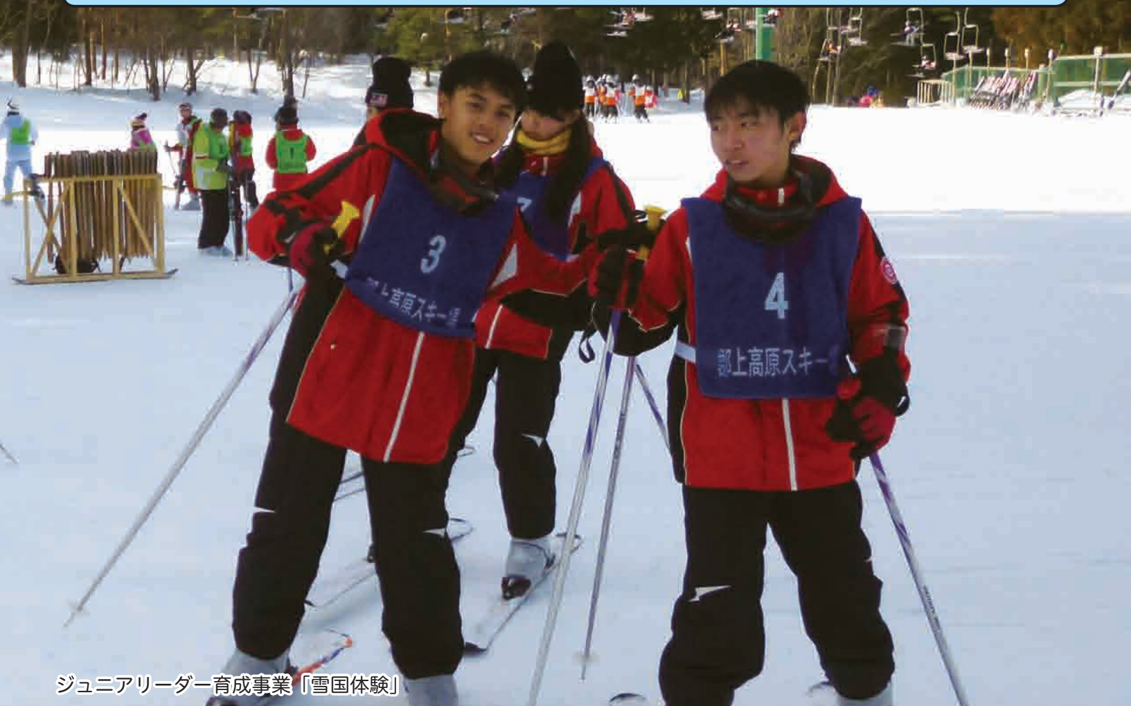
ジュニアリーダー育成事業「雪国体験」

●由良町の人口と世帯( )前月比 人口6,318 (-20) 男3,072 (-6) 女3,246 (-14) 世帯数2,753 (+161) (平成27年1月末現在)