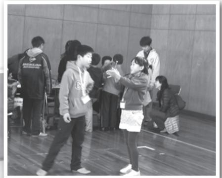
おもしろサイエンス