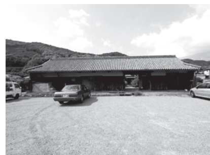
改修前写真：木造平屋建（築150年以上）

「施設名」もしくは「番号」、「選んだ理由(任意)」、「住所・氏名」を必ずお書きください。