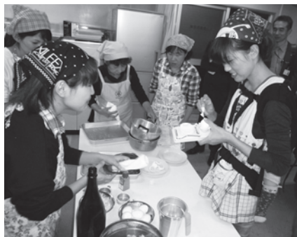
「おやこ食育教室」～簡単な朝食作り～

由良町教育委員会が、10月8日から12月3日の間に5回の講座をゆらこども園及び中央公民館で開催しました。 講座には、延べ76名の方の参加者があり好評で、「来年もぜひ実施してほしい」との意見をいただきました。