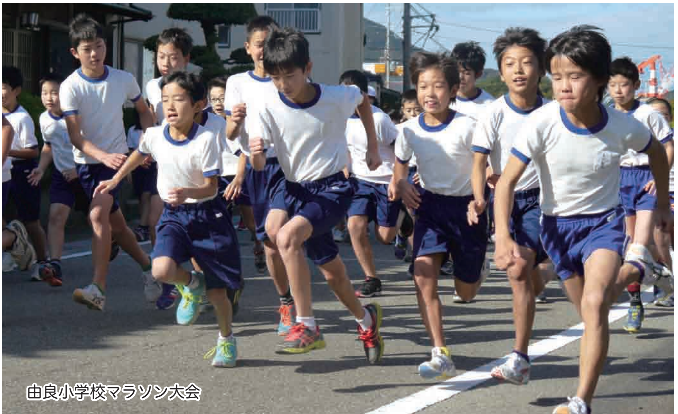
由良小学校マラソン大会

●由良町の人口と世帯( )前月比 人口6,360(-3) 男3,092(-5) 女3,268(+2) 世帯数2,593(-2)(平成26年11月末現在)