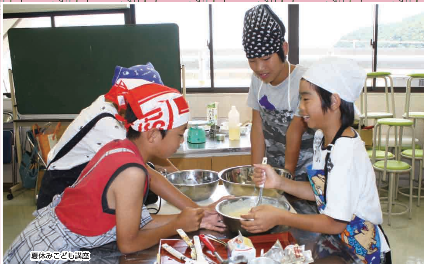
夏休みこども講座

●由良町の人口と世帯( )前月比 人口6,386(-11) 男3,106(-6) 女3,280(-5) 世帯数2,606(+5) (平成26年7月末現在)