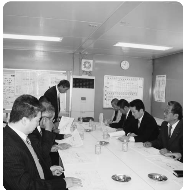
工事日程説明を聞く