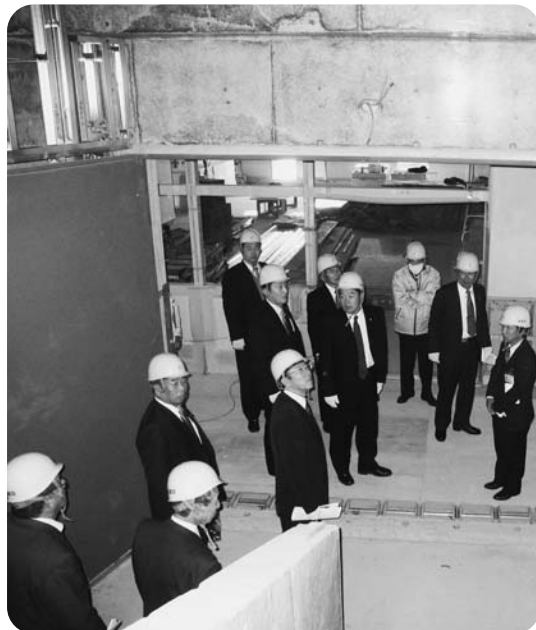
由良中学校工事現場視察

ここ 光と恵み 満ちる所 潮騒ひびく 春風を受け 両手かざして 夢を描く 由良の学舎 幸く あり待て この力 信じるなら われら 遠くまで行ける 今 誇りと誓い 胸にひめ 水仙薫る 岬の雄姿 冬の嵐も 耐えて行く 由良の学舎 幸く あり待て この力 信じたから われら 希む道あゆむ さあ 勇気と優しさ 糧にして 豊かな文化 育む森の 輝く夏の 栄光へ 由良の学舎 幸く あり待て この力 信じるんだ われら いつか空翔ける