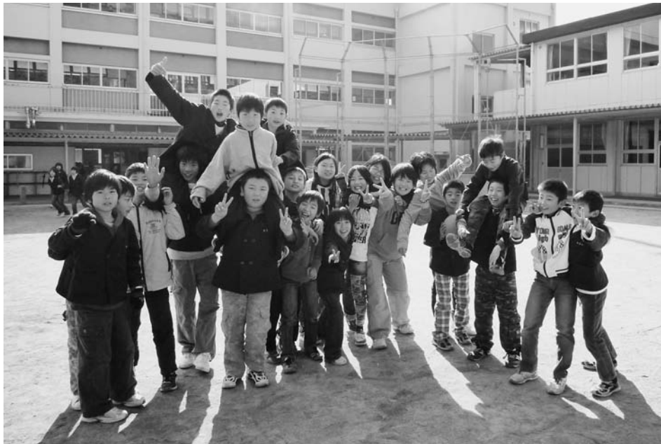
元気でガンバレ (由良小)

平成20年度第4回定例会は、12月10日(水)から12月18日(木)まで9日間の会期で開催され、一般会計補正予算、大引、神谷地区クリーンセンター建設工事請負契約締結について、教育委員任命について等、15議案が慎重に審議し可決しました。