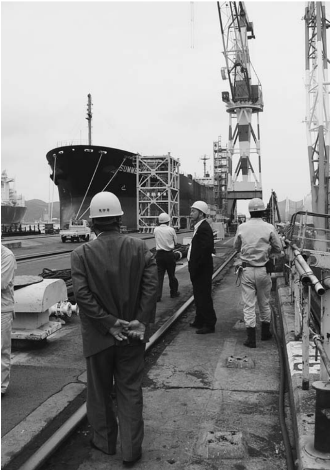
委員会企業視察 (MES由良工場)