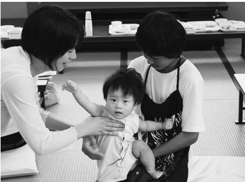
思春期体験学習 (白崎中)

平成21年度に助成予定の事業は、御坊市民教養講座に280万円、熊楠の里音楽コンクールへの50万円の助成事業を予定しています。