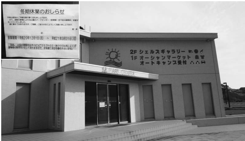
白崎海洋公園パークセンター