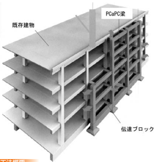
由良小耐震予定工法

答 (教育課長) 児童、教職員合わせて全員200名が一同に入れる教室は無く、壁を破ってランチルームを開設する事は耐震上無理です。由良小学校では、給食開始時期から学校側の判断で各教室で食べることにしています。