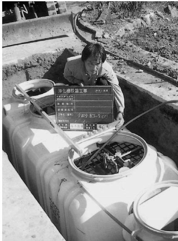
合併浄化槽設置風景

問 県の合併浄化槽設置助成金は、市町村負担軽減を目的に行われているが、県の方針では改築に特化した補助制度となり新築の家には補助金が出なくなる。この見直しはおかしいのではないか？