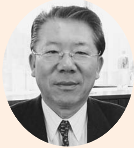
上野 諭 議員