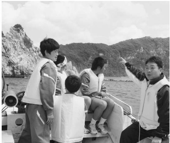
クルーズ体験 (白崎中)

今後は、統合による不登校やいじめ等が発生しないように気をつけていきたいと思っております。