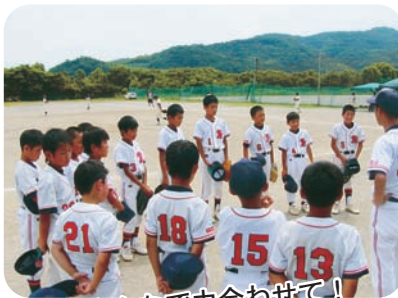
みんなで力合わせて!