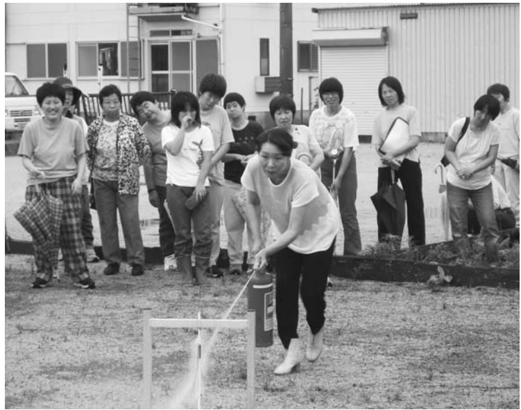
狙いを定めて（婦人防火クラブ）