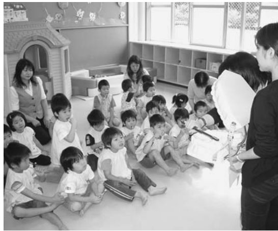
歯みがき上手にできるかな？ (中央保育所)