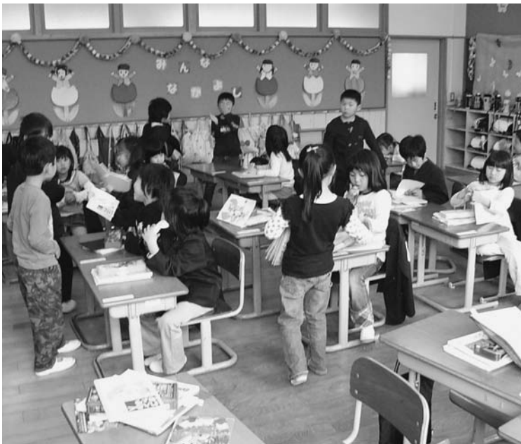
楽しく勉強(由良小)