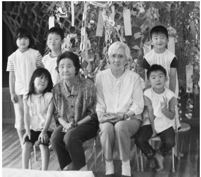
いつまでもお元気で (中央保育所)

12世帯で、単身世帯、夫婦世帯、またはどちらかが75歳以上、また75歳未満、また同居世帯という感じです。