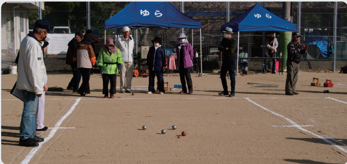
ペタンク大会 町民グラウンド

【町長】80歳以上の高齢者や70歳以上の運転免許自主返納者に対して、1万5000円分のバス・タクシー運賃助成や、配布を希望する65歳以上の高齢者に対して、救急医療情報キットを配布しています。