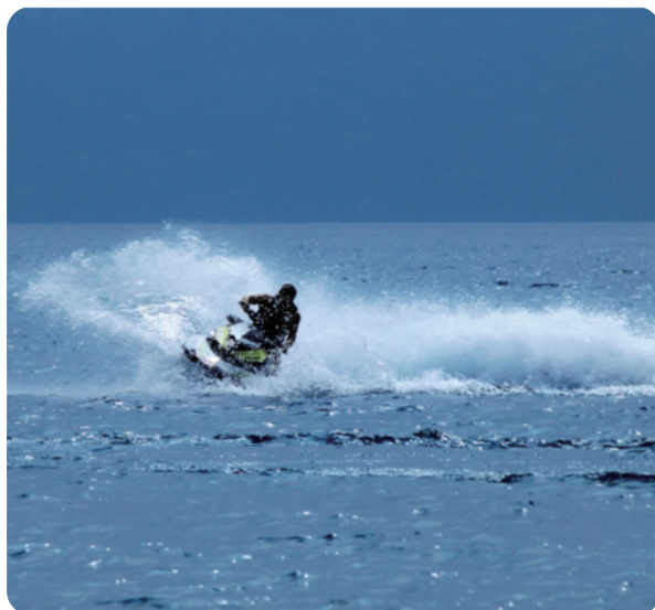
定置網漁業者を悩ませている水上オートバイ（画像はイメージです）