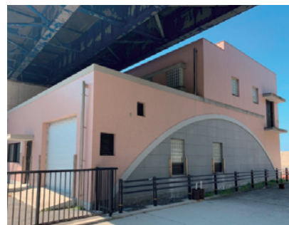
戸津井処理場（外観）