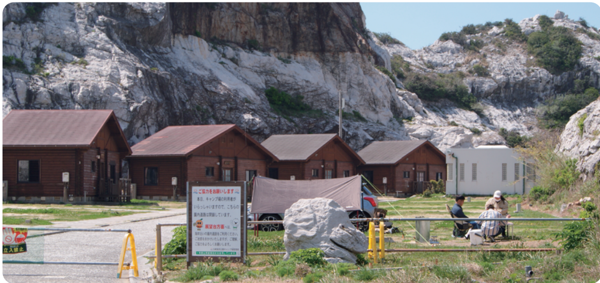
白崎海洋公園ログハウス