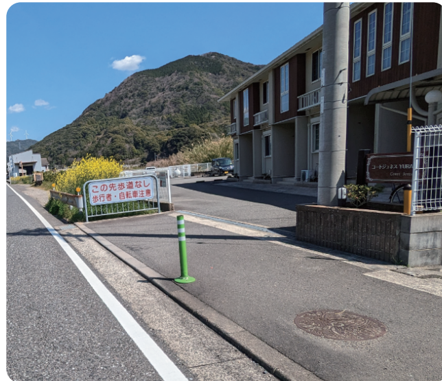
国道42号線（歩道未整備の区間）中地内