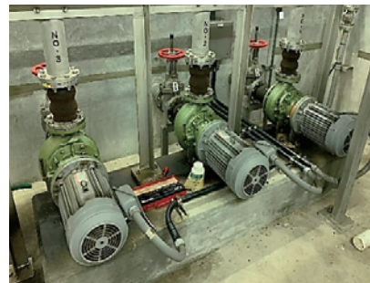
戸津井処理場（内部）

それに対して、統合すると約3億2,000万円となり、50年間で約5億2,000万円のコスト削減が見込まれますので、衣奈クリーンセンターへ統合するのが有利と考えます。