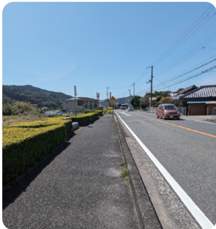
国道42号線中地内(広川方面から)