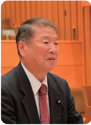
野田 悟 議員

畑区で「国道42号改良促進の会」を立ち上げていただいて、非常に心強く思っています。今後とも、多くの関係者の方々の、お力添えもいただきながら、町民の思いを伝えていきます。