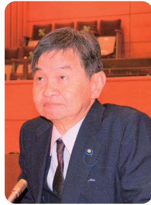
岩崎 清和 議員