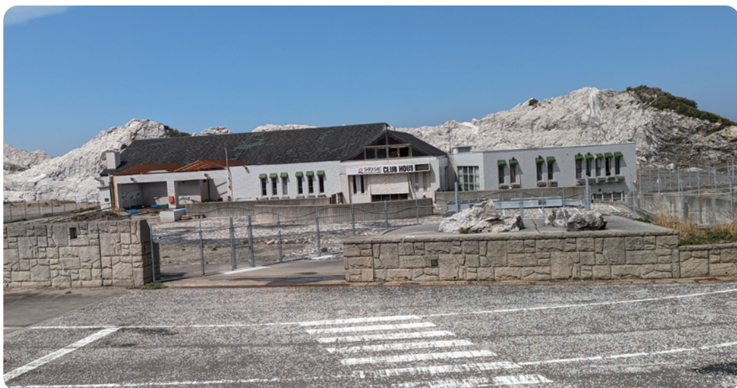
白崎海洋公園クラブハウス

なお、ハード整備は、度重なる災害を教訓として、クラウドファンディングを考えるなら、慎重に考える必要があると思いますので、研究させていただきます。