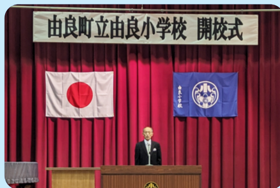
小学校も新しく動き出しました