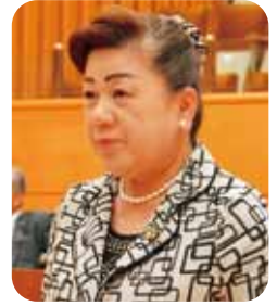
森 三枝子 議員