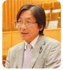
中谷 茂生 議員