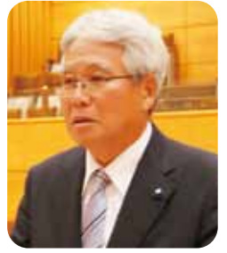
三好 章五 議員