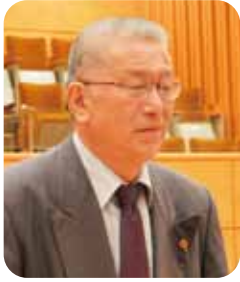
川出 純 議員

また、広場への飛び出し防止のフェンス的なものやベンチの設置については、必要に応じて設置の検討をしていきたいと考えています。