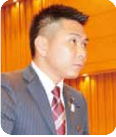
山本 大 議員