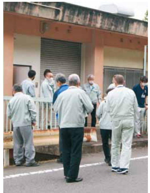
取水ポンプ場(日高川町)

また、老朽化対策としては、現在、取水・中央ポンプ施設の更新事業を県営共同事業として、令和6年度の完成に向け実施しているところです。