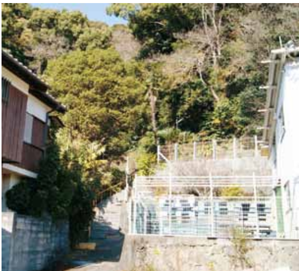
避難道路の見直しを (網代・横浜地内)

皆様が避難できるよう、 避難場所や避難路の整備 に努めていきたいと考え ています。