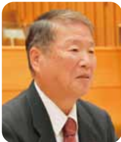
野田 悟 議員