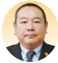
議員 玉置 一郎