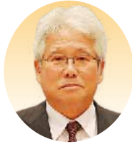
議員 三好 章五