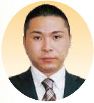
議員 山本 大