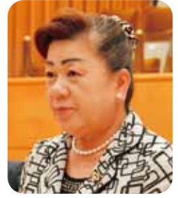
森 三枝子 議員