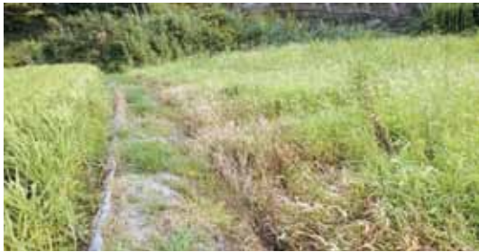
増えている耕作放棄地

農地を維持することも重要ですが、このままでは農地として使えなくなる田畑が増加する一方で、耕作放棄地の用途開発を切に感じています。また、由良町で家を新築するにしても宅地がない、価格が高いとよく耳にしますが、実際は相当下落していると想定して