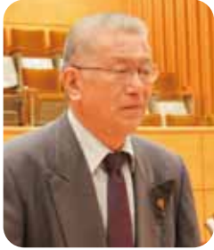
川出 純 議員