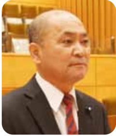
三上 幸夫 議員