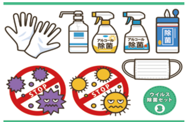
ウイルス除菌セット