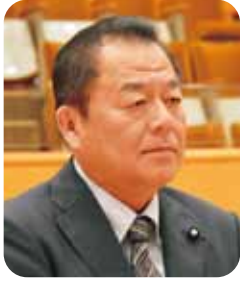
中村 真一 議員