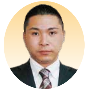
山本 大 議員