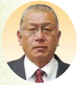
川出 純 副議長