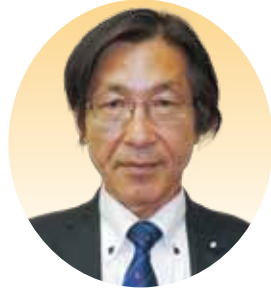
中谷 茂生 議員