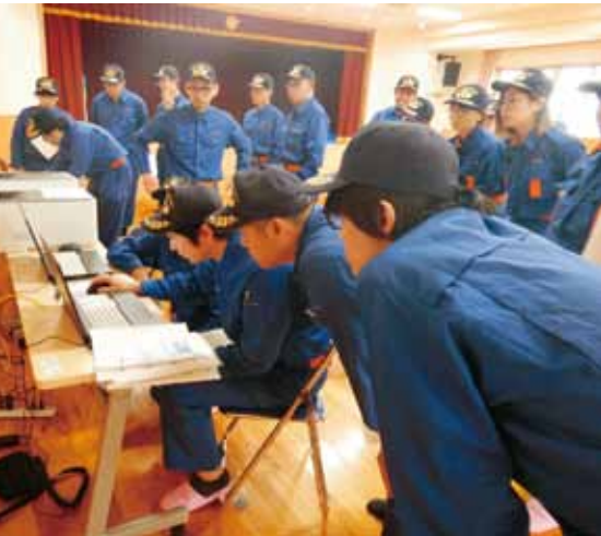
第2次災害本部(ゆらこども園)での訓練

県防災情報システムの通信の確認や、防災行政無線の操作確認及び衛星携帯電話の通信確認を行い、また、資機材の使用訓練として、マンホールトイ