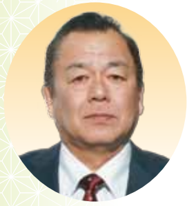
中村 真一 議員