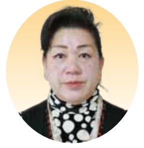
森 三枝子 議員