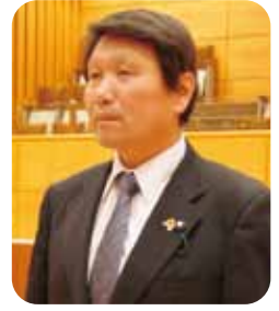
山名 実 議員