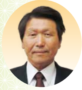
山名 実 議員