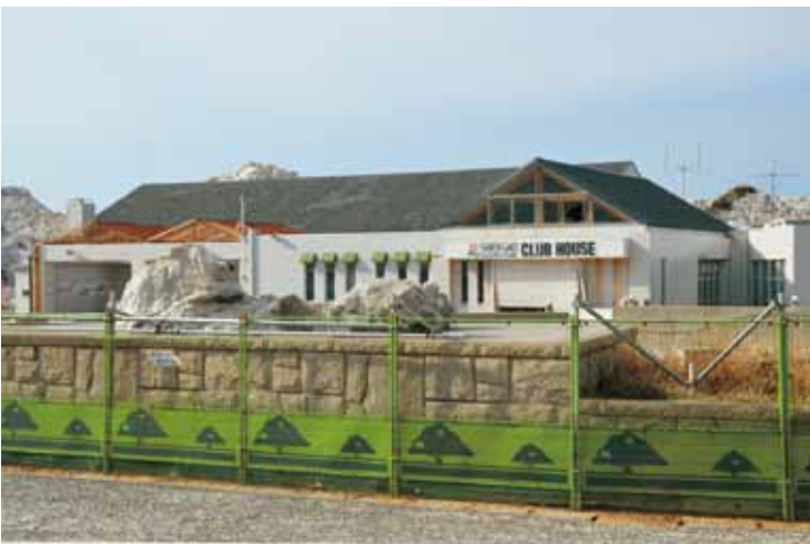
撤去予定のダイビングクラブハウス