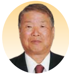
野田 悟 議員