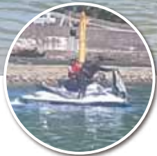
危なくないのか 水上バイク(衣奈海浜)