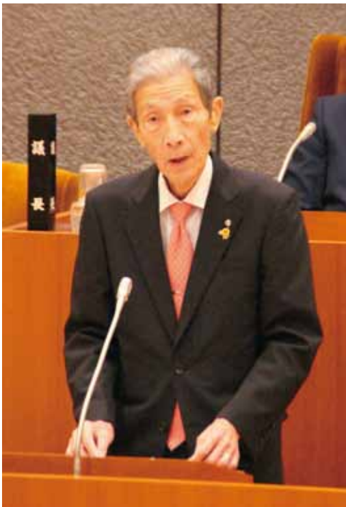
今期限りで勇退される畑中町長

れらを実現できるように町政を引っ張っていきたい。与えられた任期の中で最善を尽くし、議会の皆さん方の協力を得て、任期を終えたいなと思っていますので、町民の皆さん方のご協力を心からお願いいたします。