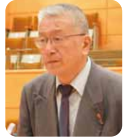
川出 純 議員