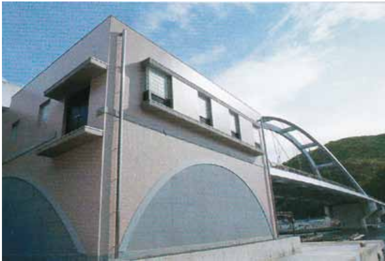
戸津井クリーンセンター(平成15年3月末供用開始)

機械は、供用開始から年数が経過している部分は、水道と比べて下水は傷みが早く、既に交換した部品もあります。