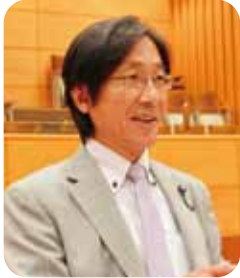
中谷 茂生 議員