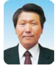
議長 山名 実