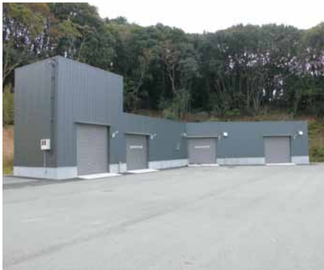
ヘリポート敷地内の備蓄倉庫(吹井地区)

自主防災組織で、炊き出しなどを行ったところもありますが、全ての活用ができていないところがあります。