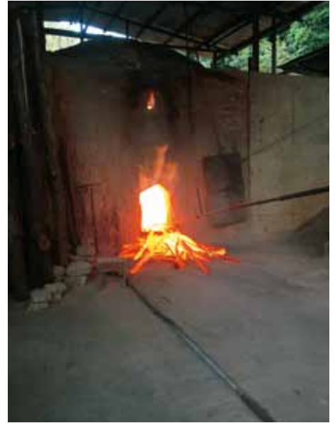
紀州備長炭の製炭窯