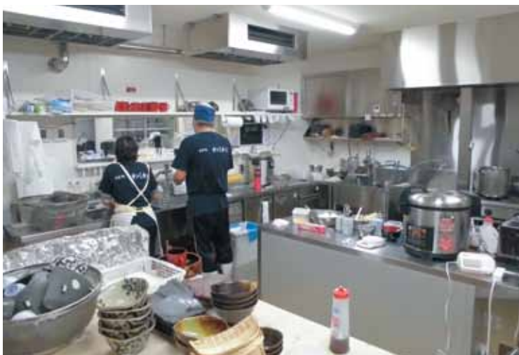
整備された「ゆらっと紀州」の台所(中地区)

答 総務政策課長 工事の内容は「ゆらっと紀州」の台所を整備しました。現在、NPO法人が、今年5月から、そば店を開店し、町内外を問わず、県外からもお客さんが来られています。相乗効果で物産販売も増え、整備した効果はあると思っています。