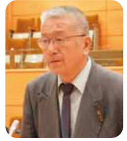
川出 純 議員