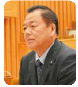
中村 真一 議員