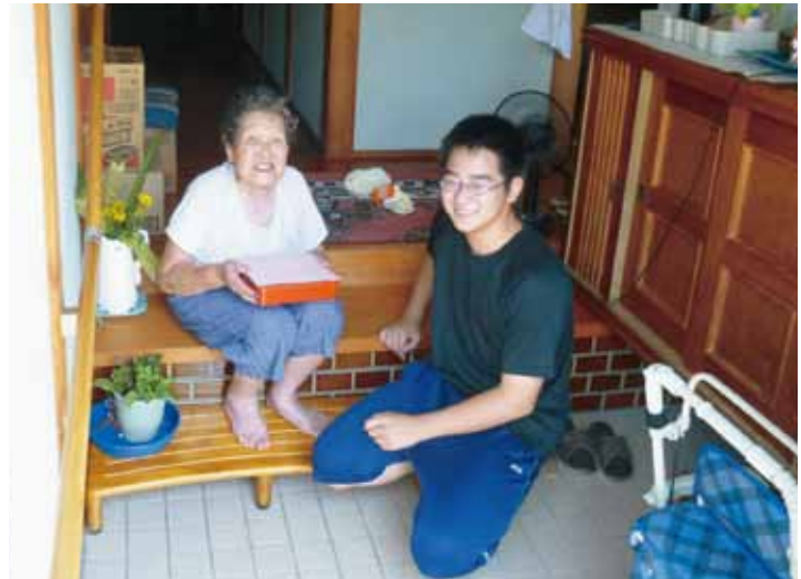
由良ジュニアリーダー配食ボランティア