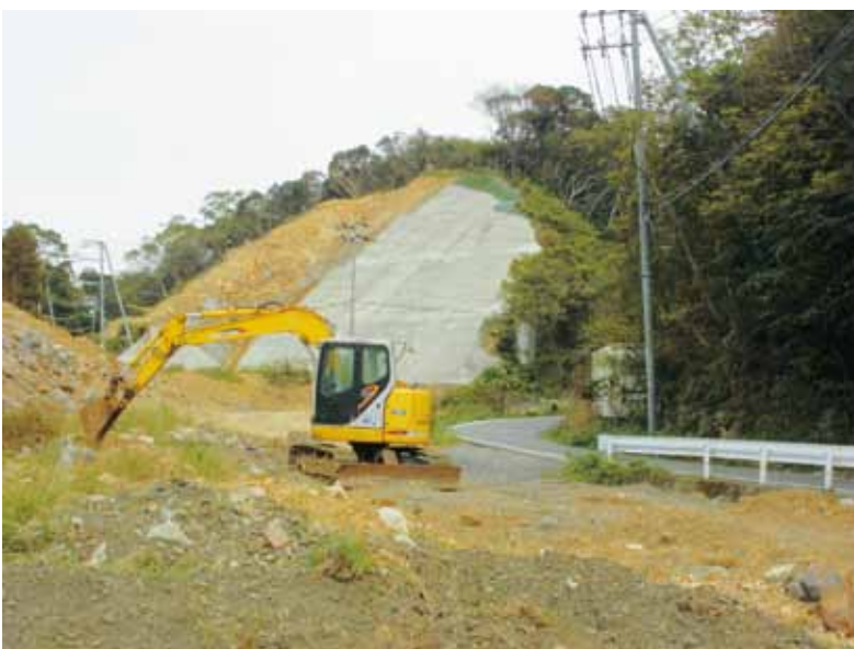
町道3-123号線(衣奈～三尾川間の峠付近)

産業建設課長 執行も考えた交渉を。現時点では買収できていない土地も多くあります。 最終的には強制収用も視野に入れ、工事と並行しながら予算の執行に努力していきます。