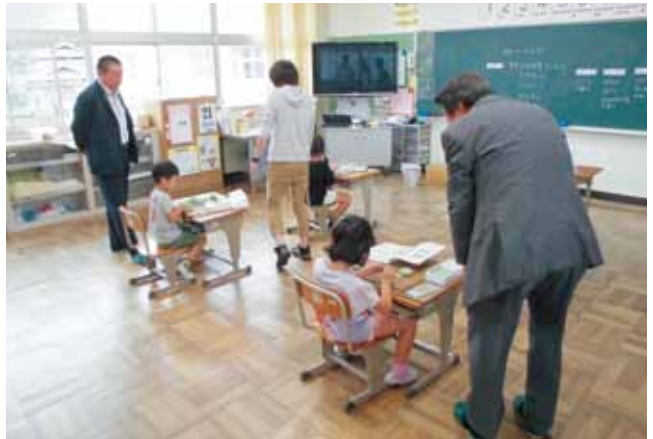
衣奈小学校 教育目標 「豊かな人間性を持ち仲間と共に伸びる子どもを育てる」 (児童数26名)