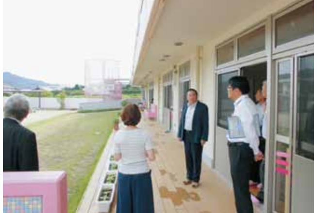
ゆらこども園 教育・保育目標 「こども1人ひとりが安心して過ごせる保育」 (園児数122名) 6月1日現在