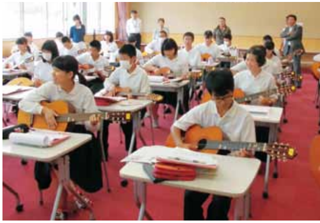
由良中学校 教育目標 「共に育む豊かな学びと人間性」 (生徒数92名)