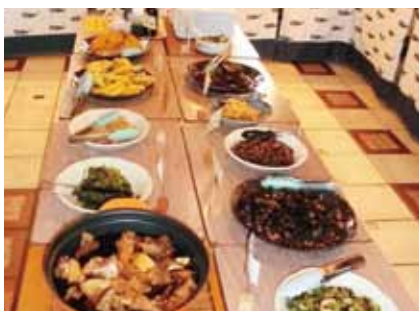
白崎海洋公園内に漁農レストラン「ゆらら」がオープン。 中学生以上1500円、町民割引もあります。

社名が、RP東プラ株式会社になって2年です。身近な生活から社会のインフラまでを支える、幅広いプラスチック製品を提供。