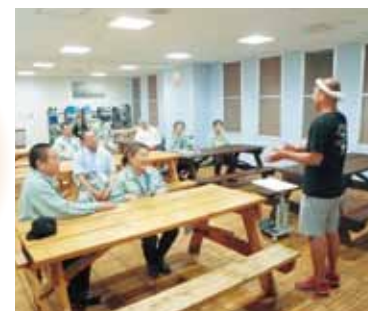
関係者から説明を受けました