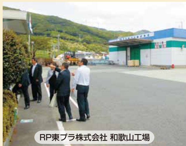
RP東プラ株式会社 和歌山工場

社名が、RP東プラ株式会社になって2年です。身近な生活から社会のインフラまでを支える、幅広いプラスチック製品を提供。