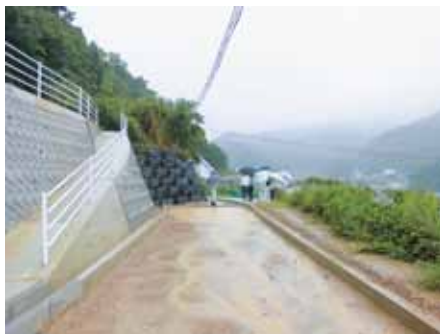
(大引区) 町道を整備中。