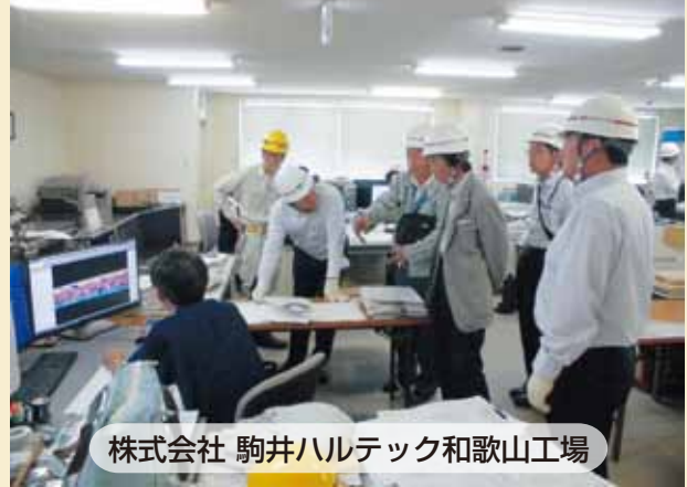
株式会社 駒井ハルテック和歌山工場

MES-KHI由良ドック株式会社では現在、関連企業も含めて約300名の方が働いているそうです。これから暑くなりますので熱中症にならないように、ご注意ください。