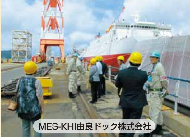
MES-KHI由良ドック株式会社

MES-KHI由良ドック株式会社では現在、関連企業も含めて約300名の方が働いているそうです。これから暑くなりますので熱中症にならないように、ご注意ください。