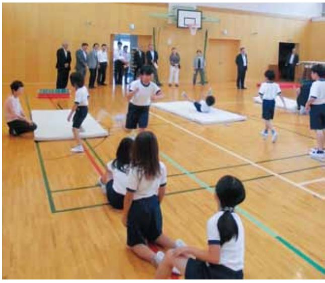
白崎小学校 教育目標 「豊かな感性をもち、自主性と創造性にとむこどもの育成」 (児童数66名)