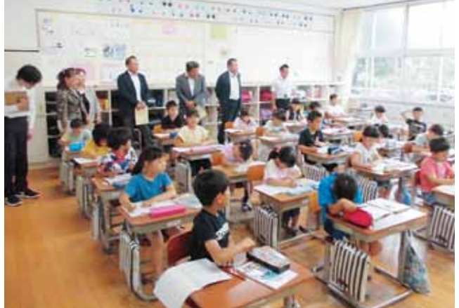
由良小学校 教育目標 「やさしく、かしこく、たくましく」 (児童数168名)