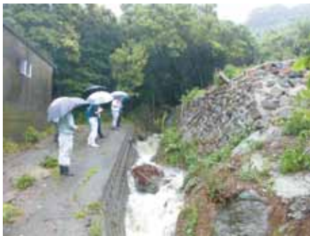
町内工事箇所視察 (小引区) 6月20日 避難場所の土台の強化を!!

今回は、会社の心臓部である設計部を訪問。パソコン上の画面で、立体的で正確な設計図面を見せてもらいました。