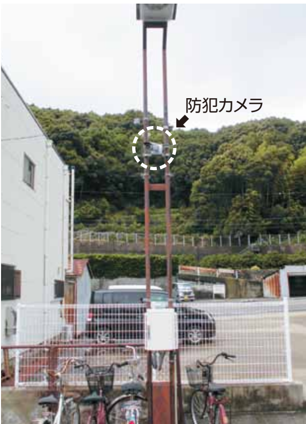
JR紀伊由良駅付近防犯カメラ

いるのではないかと思います。検討した中で必要に応じて設置していければと思っております。