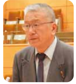
川出 純 議員