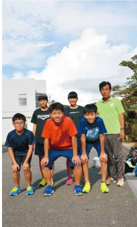
由良中学校陸上部

中学校部活指導員の報酬等が決まる 中学校部活指導員(非常勤の特別職の職員)に対して、1時間、1600円以内の報酬と費用弁償を定める